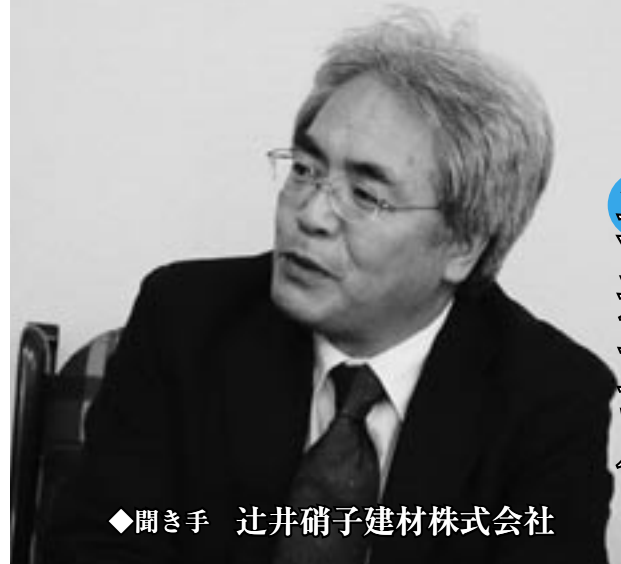
◆聞き手 辻井硝子建材株式会社

して活用し、地場産業の振興にも役立てたい”という強い思いから、加工技術によって硬くする研究を岐阜大学や生活技術研究所のご協力を得ながら重ねてきました。また、2003年には森林組合や製材業者など5社で「飛驒杉研究開発協同組合」を立ち上げ、川上から川下まで一貫した流れを確保し、研究を進めてきました。