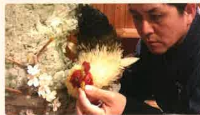
お菓子の匠工芸館 全国の菓匠たちが伝統の技を駆使して作った、美しい工芸菓子を展示します。

「全国菓子大博覧会」はお菓子の歴史と文化を後世に伝えるとともに、菓子業界、関連産業の振興と地域の活性化に役立てるため、ほぼ4年に1度開催されてきました。今回で27回目の開催となり、三重では初めてとなります。1911年(明治44年)に東京で「第1回帝国菓子大品評会」として始まり、東海エリアでは1977年静岡以来の40年ぶりの開催となる「第27回全国菓子大博覧会・三重」にご期待ください。