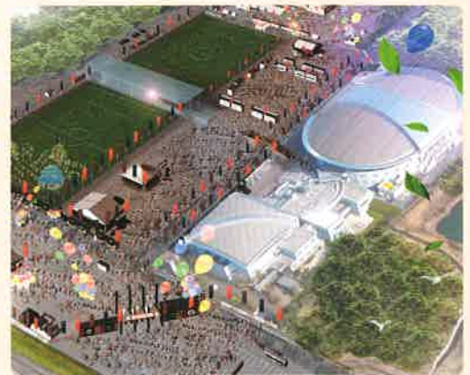
画像はすべてイメージです。